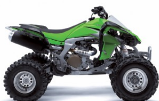
Lime Green/Super Black (Grün/Schwarz)