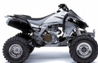
Bright White/Super Black (Weiß/Schwarz)